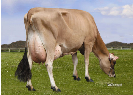
LUCKY HILL JOKER WABORITA FOURTH DAM